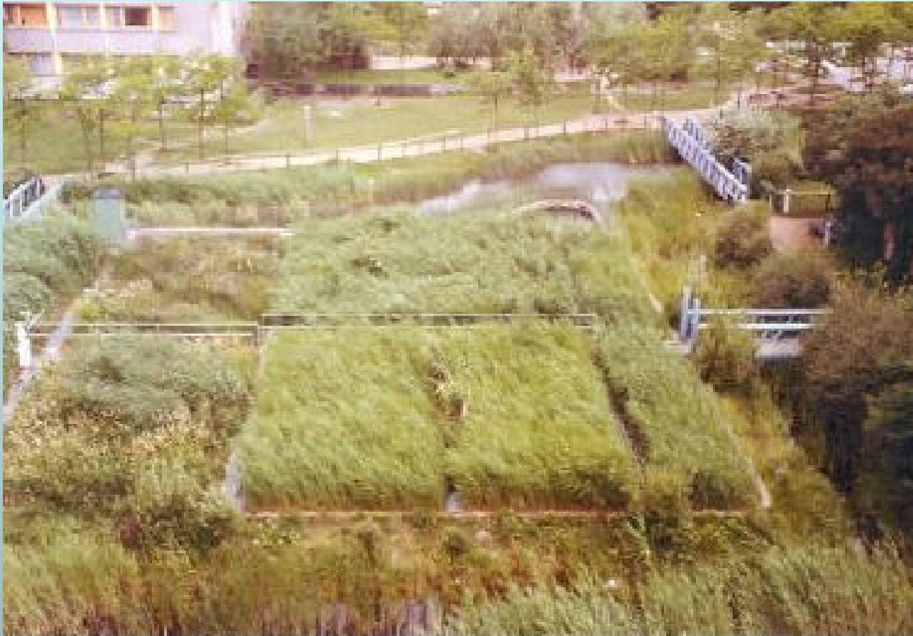
Sistema di fitodepurazione HF per le acque grigie